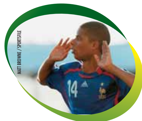
Let's hear it! French attacker Kevin Monnet-Paquet celebrates after completing his hat-trick in the 5-2 opening-day victory over Serbia.