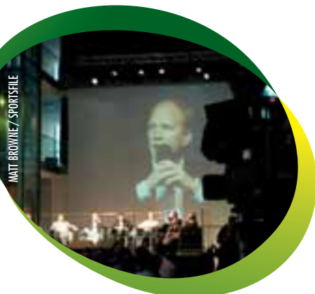
Pegged to the tournament, the Austrian national association staged a coaching symposium at the Landesbank headquarters in Linz. As the giant screen demonstrates, the man with the microphone is the German national association's Technical Director, Matthias Sammer.