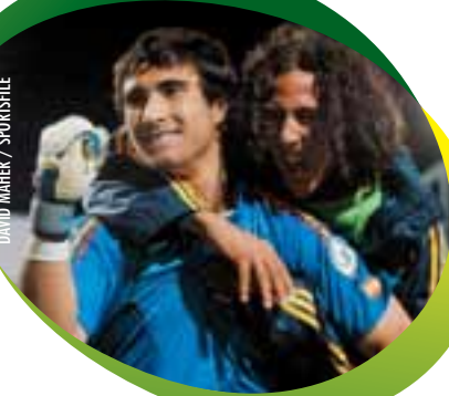
Spain's reserve goalkeeper Sergio Asenjo, on for the injured Felipe Ramos after 56 minutes of the semi-final against France, celebrates after making the decisive save in the penalty shoot-out.