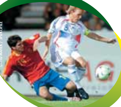
French midfielder Malaury Martin (8) is determined to skip over a tackle by Spanish defender Mikel Sanjosé during the semi-final in Pasching.