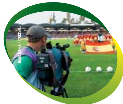
A TV camera captures images as the Spanish and Greek players line up for the national anthems prior to the final in Linz.

The event attracted a great deal of media attention, not least because the Austrian Under-20 team was, in parallel, performing well at the FIFA World Cup in Canada. Nine of the matches were televised live by Eurosport, with networks in participating countries also screening matches played by their national teams. The fact that many of the players were already playing first-team football at their clubs – but none of the Spanish champions, it has to be said – also helped to give the final tournament a high profile.