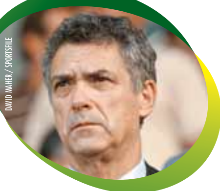
Angel Villar, president of the Spanish federation, watches anxiously as his side works hard to complete an age-limit double in Linz and confirm Spain's status as a trendsetter in youth development.