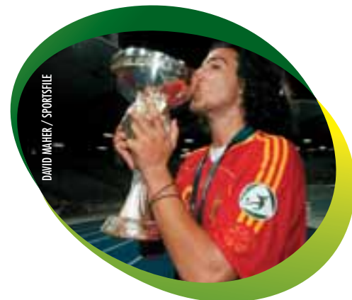
Daniel Parejo von Real Madrid küsst die Trophäe, nachdem sein Freistoss in der ersten Halbzeit das einzige Tor des Endspiels geblieben ist.