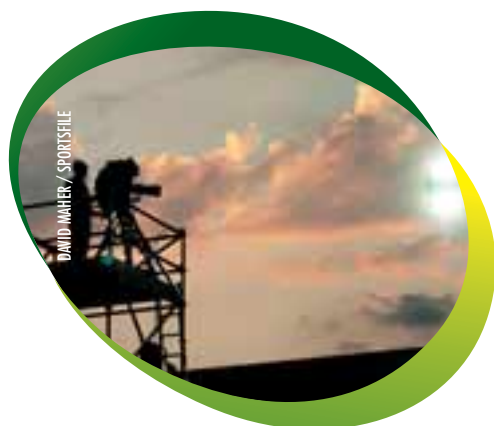
Silhouetted against the evening sky – and happy to get a bit of breeze – a Eurosport cameraman is on duty behind the goal at the Waldstadion as the hosts take on Greece in Group A.