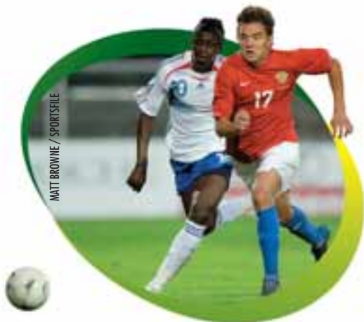
Russia's Andrey Ivanov breaks away from French midfielder Bakary Sako during the only goal-less fixture in a high-scoring Group B.