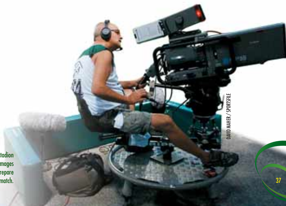
A camera on the touchline at the Waldstadion in Pasching looks for off-the-field images as the German and Serbian teams prepare to come out for their crucial Group B match.