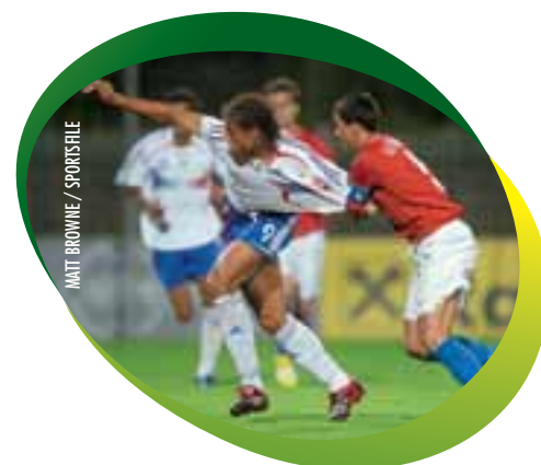
Russian defender Sergey Golyatkin conducts some destruction-testing on the French No. 9 shirt worn by Rudy Gestede during the final group game in Steyr.